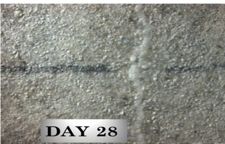
Day 28 (Crystallization Matures)