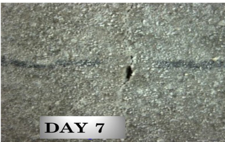
Day 7 (Crystallization starts)